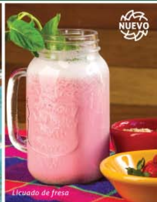
Licudo de fresa