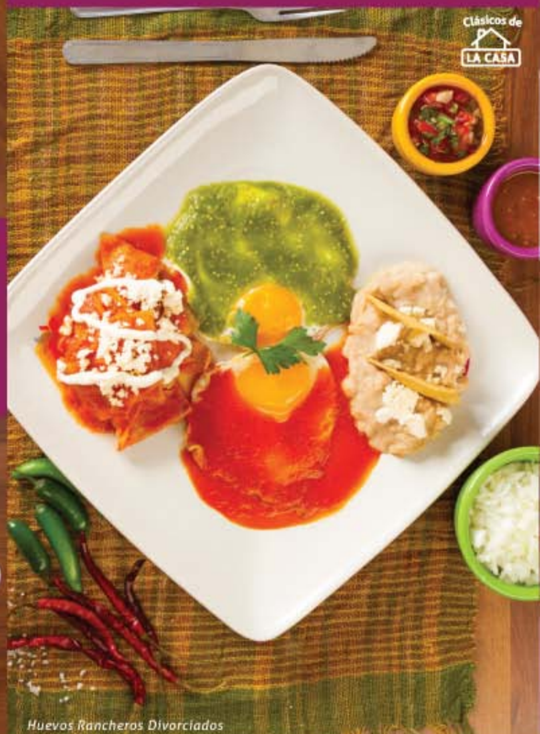
Huevos Rancheros Divorciados