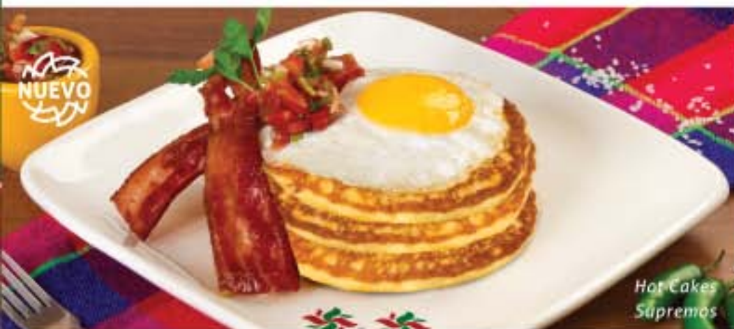
Hot Cakes Supremos