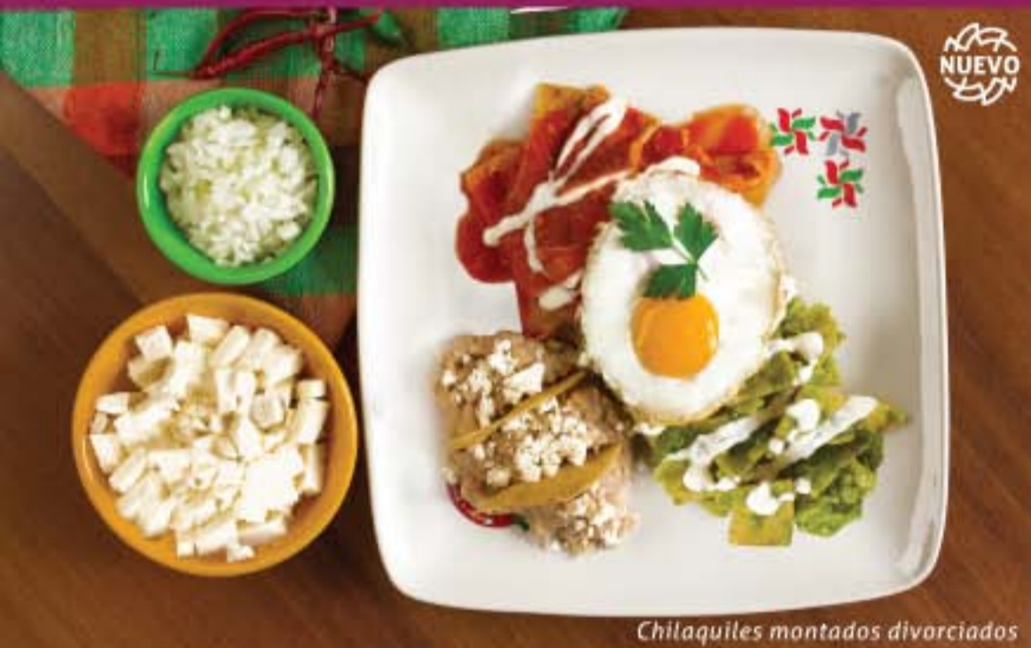
Chilaquiles montados divorciados

Preparados especialmente para que recuerdes los buenos momentos con tus seres queridos