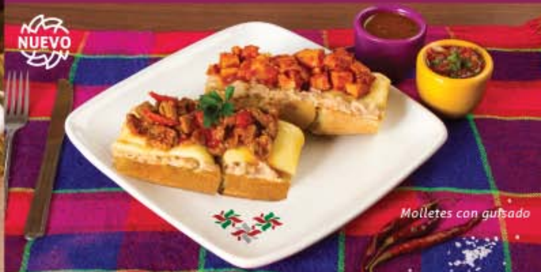
Molletes con guisado

Estamos seguros que no los encontrarás en ningún otro lugar ..... 76.00