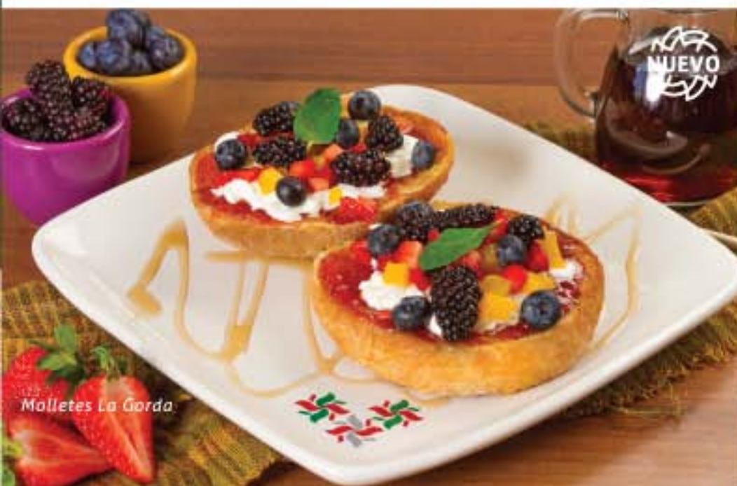
Molletes La Gorda

Únicos en su estilo, el equilibrio perfecto entre mermelada de zarzamora, frutos rojos y queso cottage. .... 76.00