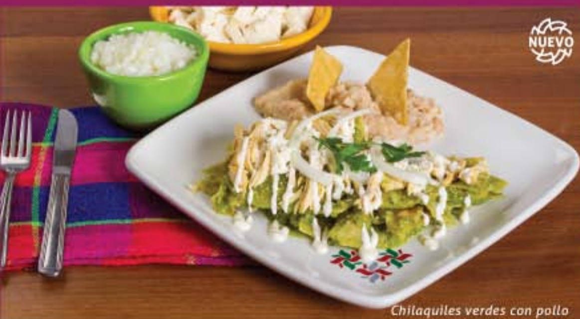
Chilaquiles verdes con pollo