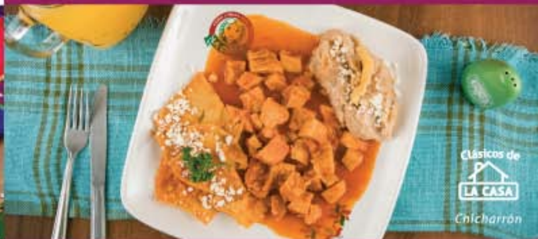
Clásicos de LA CASA Chicharrón

Deliciosa pancita ni muy grasosa, ni muy reseca, en su punto. .... 83.00