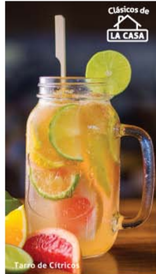
Tarro de Cítricos